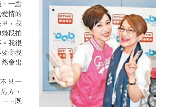
陳法蓉經歷過多段感情都失敗，但追求公主王子式愛情的心，一直未變。