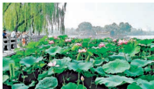
大明湖荷花盛放，吸引八方來客觀賞。