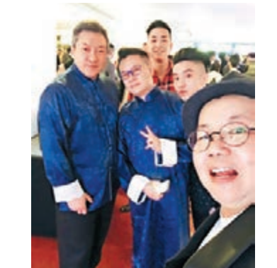
漢洋(左二)是一個醒目的藝人。