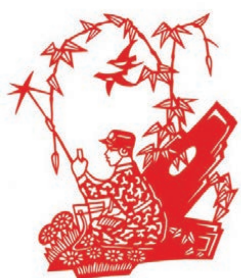
■ 剪紙《刻苦訓練》 作者：劉松柏