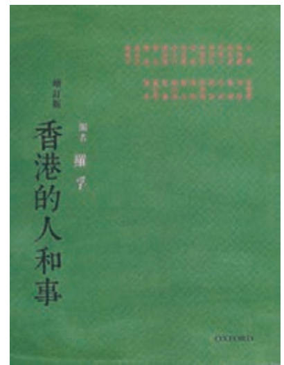
■ 這書要求不作虛構，但有若干篇值得商榷。