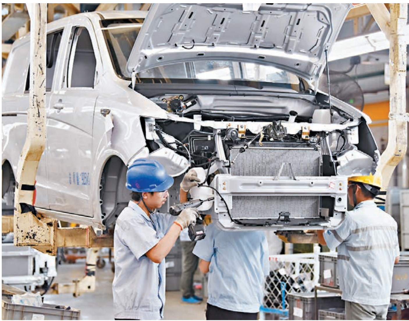
內地7月官方製造業和非製造業PMI雙雙小幅回落，但總體看與上半年均值基本持平，且持續運行於較高景氣區間。圖為工人在河北長安汽車有限公司車輛生產車間工作。

不過，從7月PMI數據也顯示，經濟增長仍面臨不少挑戰，近四成企業反映勞動力成本上漲，企業用工成本壓力依然較大，同時企業購進價格的上升明顯，但出廠價格指數上升滯後，升幅僅3.6個百分點，可能導致下游行業成本會明顯增加，效益下滑。