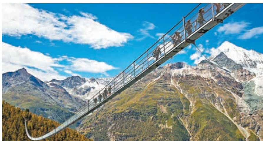
■吊橋位於瑞士最高峰多姆峰一座山谷上。

吊橋位於瑞士最高峰多姆峰一座山谷上，全長1,620呎，與山谷底部最大垂直距離為278呎，連接瑞士山區小鎮采爾馬特及格雷興。大橋由兩條共重8噸、直徑2吋的鋼索吊起，而且更有特別設計防止搖動。山谷原本有一道舊橋，但出入口位於海拔1,640呎高位，出入極不方便，故當局在舊橋被落石毀壞後，便決定在較低位置興建新橋。每日郵報