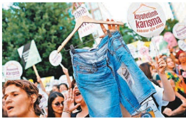
■婦女手持掛上牛仔短褲的衣架，抗議穿短褲經常被男性針對。