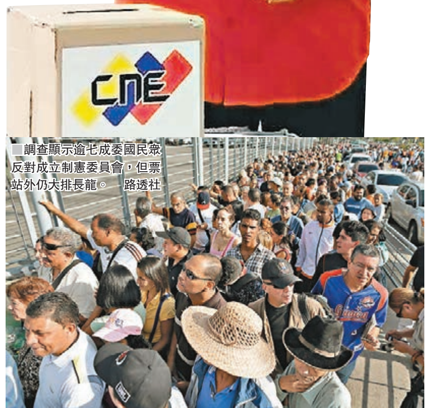
■調查顯示逾七成委國民眾反對成立制憲委員會，但票站外仍大排長龍。