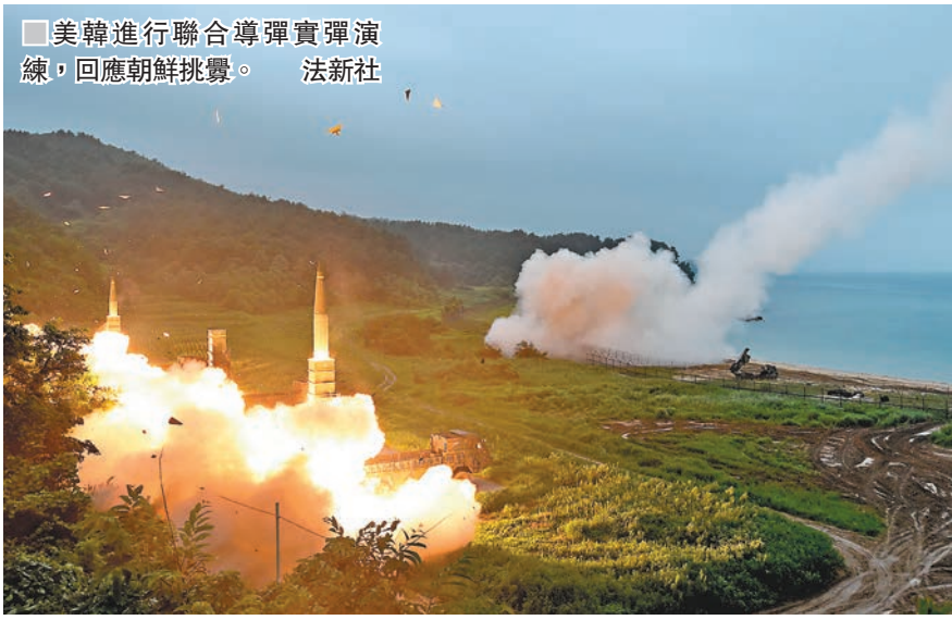
美韓進行聯合導彈實彈演練，回應朝鮮挑釁。