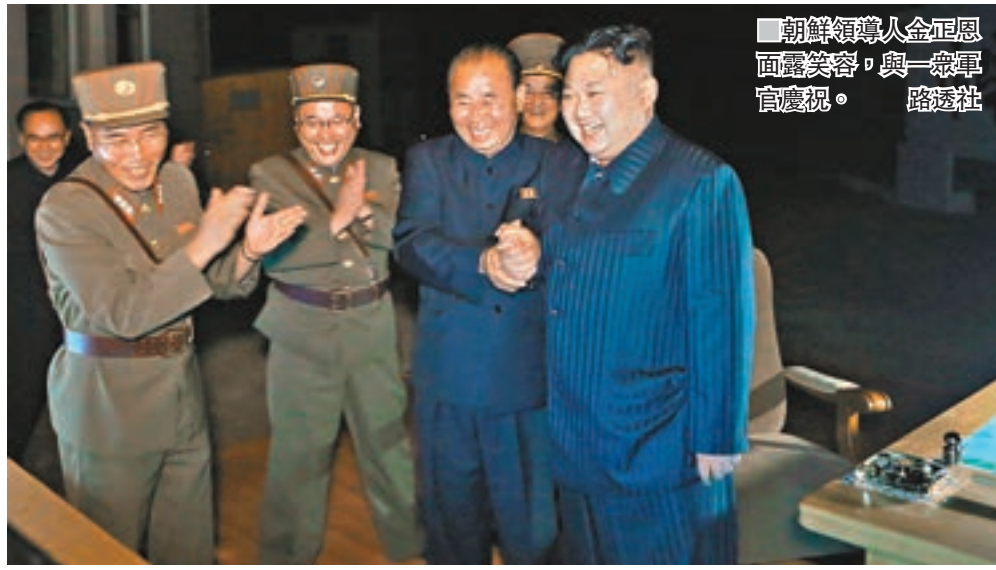
朝鮮領導人金正恩面露笑容，與一眾軍官慶祝。

朝鮮前晚再次試射「火星-14」型洲際彈道導彈，是繼本月初後，於一個月內第二次試射。專家估計，今次導彈的射程可能超過1萬公里，技術進一步提升，首次顯示有能力攻擊美國西岸，包括洛杉磯和芝加哥等大城市，以試射的飛行時間估計，甚至可射至美國東岸的紐約。朝鮮官方媒體朝中社聲稱，今次試射展示了「朝鮮有能力隨時隨地施以突襲」。美國與韓國隨即進行聯合導彈實彈演練，回應朝鮮的挑釁。韓國總統文在寅主持國家安全保障會議時表示，考慮制訂對朝單邊制裁方案。