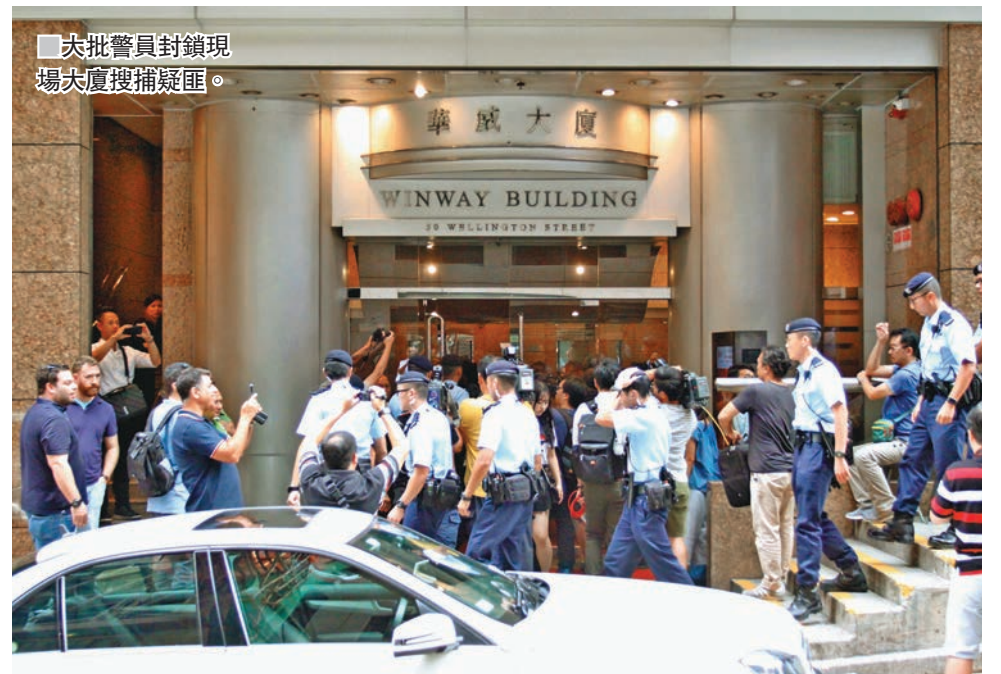
大批警員封鎖現場夾萬搜捕疑匪。

及至午膳時段,疑匪趁店內僅得一名女職員時再折返犯案,詎料觸動保安系統成甕中之鱉,終失手被捕。