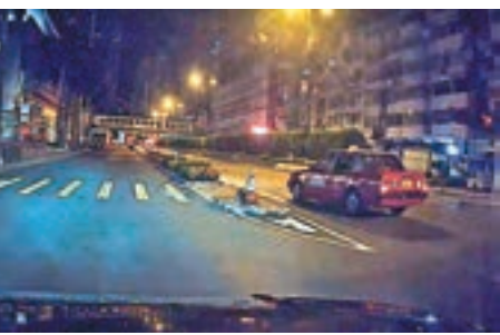
無辜被七人車擦撞的士停在路旁待處理。

處擬掉頭時,遭其中一輛追上的神秘車輛撞及,當即失控憾向路邊石壘,車頭損毀被迫停下,車上司機與乘客無受傷,忙棄車沿公路奔逃,而撞車過程則被附近其他車輛的車Cam拍下及報警。尾隨追趕的兩輛房車其後亦不知所終,整個追逐距離達20公里。