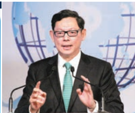
陳德霖稱，美國加息步伐及縮表時間存不確定性，市場應審慎管理風險。

香港文匯報訊(記者 周紹基)上半年環球股市屢創新高，美匯指數又持續向下，令外匯基金的股債投資大賺，匯市表現亦不俗，外匯基金半年勁賺1,265億元，創出新高，回報比去年大升1.85倍，上半年政府可以分賬114億元。不過，金管局總裁陳德霖指，環球金融市場的利好走勢未必可以持續，當局會採取防禦性部署。