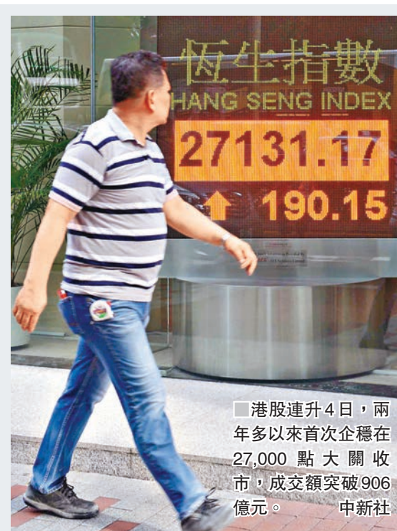
港股連升4日，兩年多以來首次企穩在27,000點大關收市，成交額突破906億元。