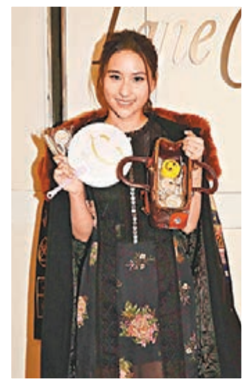
何超蓮對自己廚藝充滿信心。