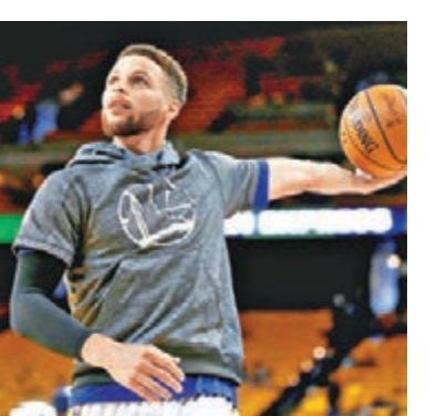
勇士王牌球星史提芬居里。法新社

撒16億留住居里 勇士敲定合約 美國職籃NBA金州勇士昨天宣佈簽署許多自由球員合約，包括當家球星史提芬居里據稱高達2.01億美元（約15.7億港元）的天價合約。 法新社報道，勇士沒有公佈與居里、杜蘭特、伊古達拉、李雲斯頓、柏卓拉敲定的合約條件。不過，居里的經紀人告訴ESPN，兩度贏得NBA最有價值球員（MVP）的居里，已經同意5年2.01億美元的合約條件。暫時合約紀錄是休士頓火箭以2.28億美元與夏爾頓延長的合約。 杜蘭特早已簽了兩年5300萬美元合約，伊古達拉的3年合約據稱總額達4800萬美元。柏卓拉的1年 勇士王牌球星史提芬居里。法新社 合約據稱價值350萬美元，利雲斯頓的3年合約為2400萬美元。韋斯達將簽一年230萬美元的老將底薪合約。 中央社