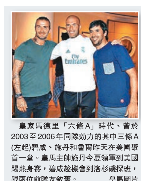
皇家馬德里「六條A」時代，曾於2003至2006年同隊效力的其中三條A（左起）碧咸、施丹和魯爾昨天在美國聚首一堂。皇馬主帥施丹今夏領軍到美國踢熱身賽，碧咸趁機會到洛杉磯探班，跟兩位前隊友敘舊。

撒16億留住居里 勇士敲定合約 美國職籃NBA金州勇士昨天宣佈簽署許多自由球員合約，包括當家球星史提芬居里據稱高達2.01億美元（約15.7億港元）的天價合約。 法新社報道，勇士沒有公佈與居里、杜蘭特、伊古達拉、李雲斯頓、柏卓拉敲定的合約條件。不過，居里的經紀人告訴ESPN，兩度贏得NBA最有價值球員（MVP）的居里，已經同意5年2.01億美元的合約條件。暫時合約紀錄是休士頓火箭以2.28億美元與夏爾頓延長的合約。 杜蘭特早已簽了兩年5300萬美元合約，伊古達拉的3年合約據稱總額達4800萬美元。柏卓拉的1年 勇士王牌球星史提芬居里。合約據稱價值350萬美元，利雲斯頓的3年合約為2400萬美元。韋斯達將簽一年230萬美元的老將底薪合約。 中央社