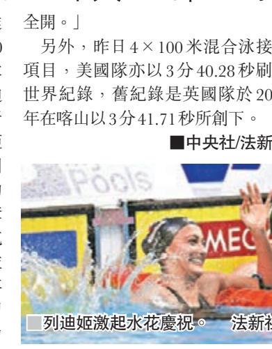
列迪姬激起水花慶祝。法新社

美國著名女泳將列迪姬昨天在布達佩斯舉行的世界游泳錦標賽女子1500米自由式項目奪金，成為首位在游泳世錦賽拿下12面金牌的女泳手。列迪姬以15分31.82秒贏得金牌，西班牙選手貝爾蒙特摘銀，大幅落後列迪姬19.07秒，意大利選手歌達雷拉得到銅牌，落後列迪姬22.04秒。20歲的列迪姬目前是世界游泳錦標賽史上奪金最多的女子選手，超越同胞法蘭克林的11面。列迪姬表示，贏得比賽並不像她故意展現的那般容易，「一年的另外364天都是艱難的，是在練習時全力以赴，然後才能在比賽時火力全開。」 另外，昨日4×100米混合泳接力項目，美國隊亦以3分40.28秒刷新世界紀錄，舊紀錄是英國隊於2015年在喀山以3分41.71秒所創下。 中央社/法新社