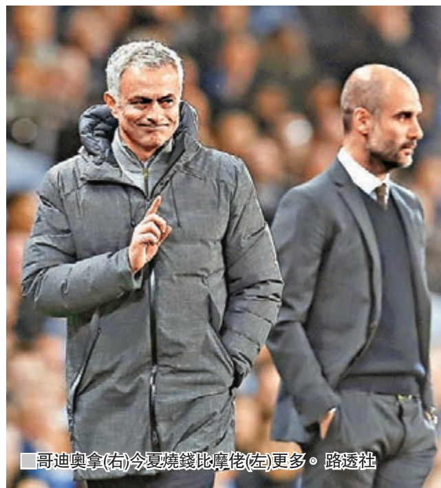
哥迪奧拿(右)今夏燒錢比摩佬(左)更多。