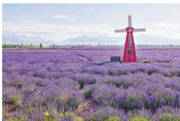
伊犁霍城縣的薰衣草花田 ■伊犁·國際旅遊谷第七屆薰衣草國際旅遊節在新疆伊犁哈薩克自治州霍城縣舉行。