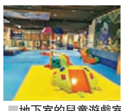
地下室的兒童遊戲室