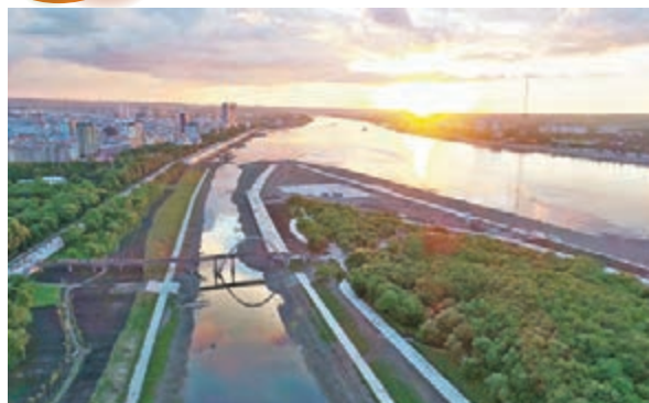
夕照醉人 ■夕陽下黑龍江黑河段的景象。