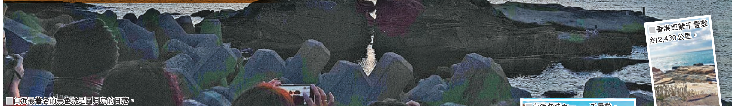
白浜最著名的景色就是圓月島的日落。

白浜町，位於和歌山縣內，為了區別千葉縣內的白浜，通常會被稱為南紀白浜。受惠日本海流（黑潮），全年氣候溫暖。町內多處溫泉湧出，白浜溫泉及椿溫泉等溫泉於日本富有盛名，同時擁有大量特色景點及如熊景古道的世界遺產，春夏秋冬各有特色，是有名的旅遊度假勝地。 ■文、攝：雨樂