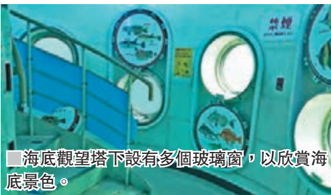
海底觀望塔下設有多個玻璃窗，以欣賞海底景色。