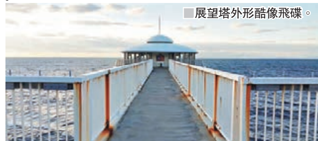
展望塔外形酷像飛碟。