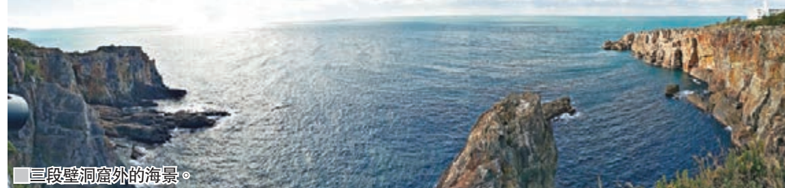
三段壁洞窟外的海景。