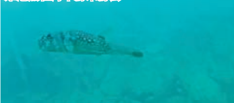
當日由於浪大，能見度不高，不過也見到雞泡魚在海中游來游去。

白浜雖然不大，但景點不少，町內有「明光巴士」來往各大景點，在JR白浜站有售各種乘車券，若打算在此消磨一日，一日券（1,100日圓）絕對是好選擇，下車時「show pass」即可。