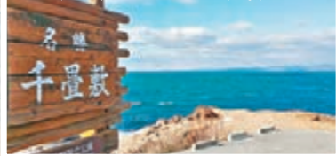
千疊敷的地形與東坪洲相近。

來到這裡，確有一種回到香港的感覺，因海浪侵蝕而成的岩石，不就是跟東坪洲一樣嗎？其實兩地的地貌確實相似，日本人眼中的絕境，在香港人眼中應該不算什麼吧。