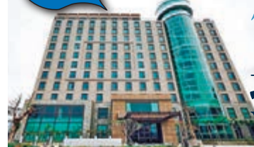
墾丁怡灣渡假酒店外觀

夏日熱辣辣，有人喜歡與陽光玩遊戲，一家人去台灣的墾丁享受陽光與海灘。墾丁的新酒店不少，5月才營業的4星級墾丁怡灣渡假酒店是墾丁新興的，不但滿足住宿，也滿足消遣，酒店內有多種親子遊樂設施。