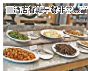
酒店餐廳早餐非常豐富