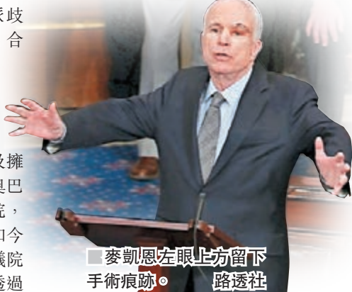
■麥凱恩眼上方留下手術痕跡。路透社

委員會徵詢各方意見，提出最能照顧不同利益的方案。在麥凱恩和作為參議院議長的副總統彭斯的關鍵兩票下，參議院當日最終以51對50票，通過啟動廢除奧巴馬醫保的辯論。■美聯社/法新社