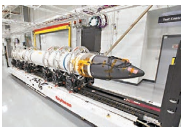
■「標準-3 Block IIA」過往曾經進行3次飛行測試。

這場防空導彈測試成本接近1億美元(約7.8億港元)，除了價值10萬美元(約78萬港元)的「標準-3 Block IIA」防空導彈外，還有部署在測試艦「瓊斯」號上的340名官兵，以及在夏威夷負責發射誘餌彈的近百名人員，他們除了負責監控誘餌彈的飛行，也派出飛機在空中密切追蹤。至於誘餌彈沒有被攔截後，已沉入大海。