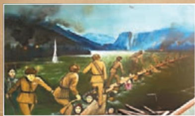
展館中的戰爭主題油畫作品再現了老人記憶中的戰場。