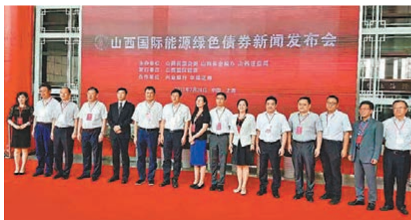
圖為山西國際能源綠色債券新聞發佈會現場。

香港文匯報訊（記者 楊奇霖）山西國際能源綠色公司債券近日在上海證券交易所舉行發行路演，首期債券將於近期擇機發行。據了解，這是中西部地區首