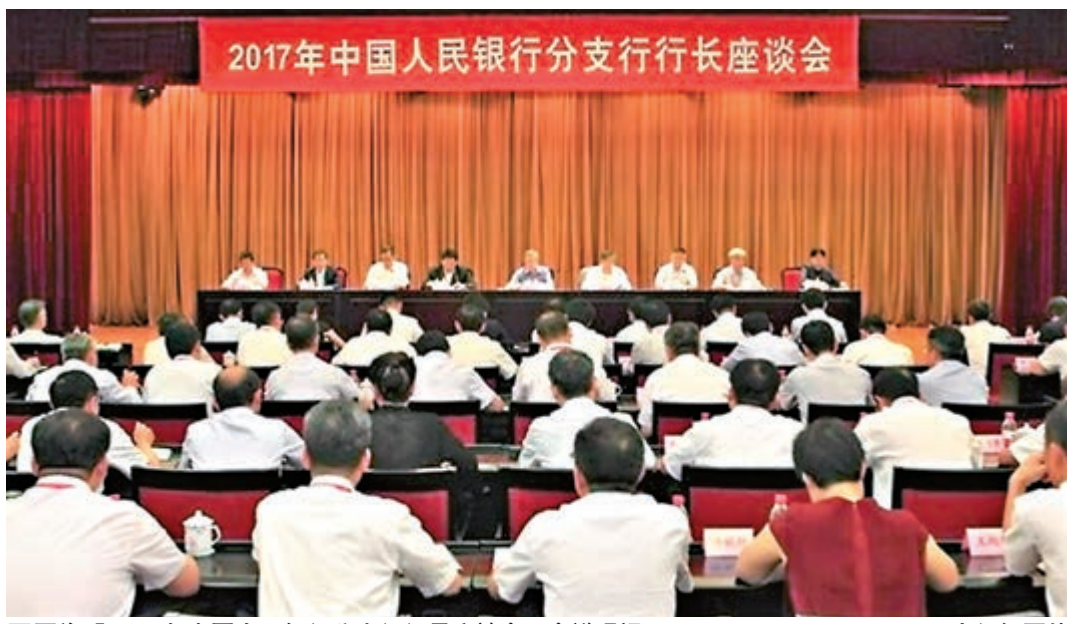
圖為「2017年中國人民銀行分支行行長座談會」會議現場。

截至6月末，商業銀行總資產達到183.9萬億元，同比增長12%，佔銀行業金融機構比例為77.7%；總負債則同比增長11.9%至170.3萬億元，佔銀行業金融機構比例為78%。大型商業銀行截至6月末總資產同比增長8.8%至85.4萬億元，佔銀行業金融機構比例為36.1%，負債同比增長8.9%，佔比為36%。