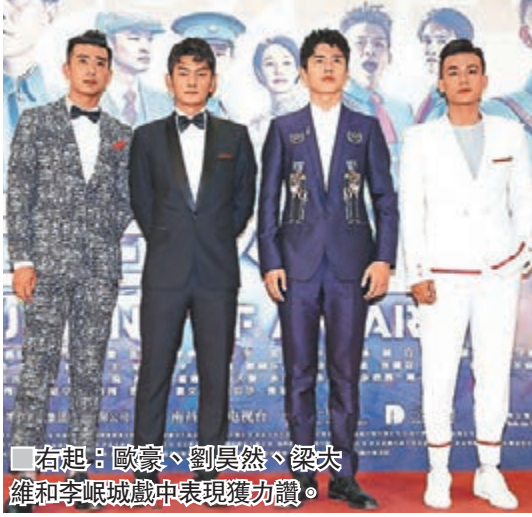
右起：歐豪、劉昊然、梁大維和李岷城戲中表現獲力讚。