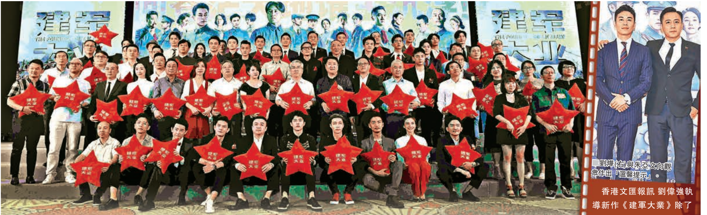
出席演員還未能達至完全晒冷陣容，但經已塞爆舞台。