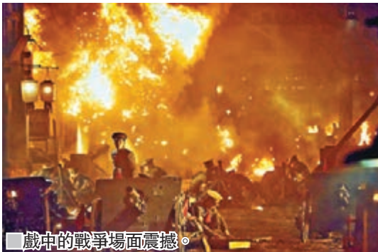
戲中的戰爭場面震撼。

由中國電影股份有限公司、博納影業集團有限公司、南昌廣播電視台、八一電影製片廠、上海三次元影業有限公司、寰亞電影製作有限公司及英皇影業有限公司聯合攝製的電影《建軍大業》，是慶祝中國人民解放軍建軍90周年的莊重禮禮。寰亞集團現特別送出《建軍大業》試映場50張戲票予《文匯報》讀者。有興趣的朋友請剪下文匯報印花，連同貼上$1.7郵票兼註明「娛樂版《建軍大業》送飛」的回郵信封，寄往香港仔田灣海旁道7號興偉中心3樓—《文匯報》，數量有限，先到先得，送完即止。 日期：7月30日 時間：下午4時 地點：灣仔會展展覽翼