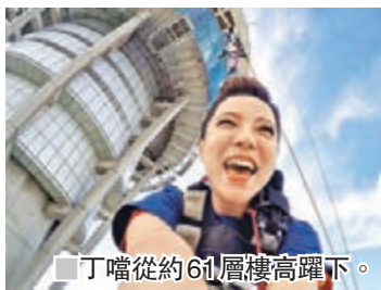
丁噹從約61層樓高躍下。

香港文匯報訊 丁噹出道十年，總是挑戰自我無極限，繼邊溜冰邊唱、邊揮揮刀邊唱歌，以及爬長城後，在十年「十項全能挑戰」清單裡又完成一項，那就是澳門塔「高飛跳」，回想在空中飛翔17秒的過程，她興奮地說：「當穿好裝備，在一旁等待的時候，一度後悔為什麼我要挑戰，但跳下去後，腎上腺素狂飆，心情很嗨，『腳踏實地』後，有種重生的感覺，覺得我很勇敢。」接下來丁噹將挑戰深潛水，對抗深潛高壓，探索海底奇觀。