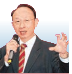
黎偉成 資深財經評論員