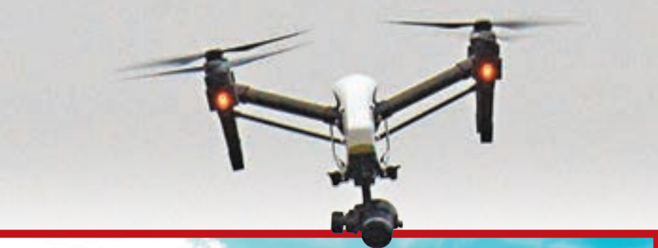
部分用戶罔顧安全，在機場附近操作無人機，英國因此加強監管。網上圖片

利用無人機「航拍」愈來愈普及，但部分用戶罔顧航空安全，在機場附近操作無人機，險釀成空難，亦有不法之徒利用無人機偷運違禁品進監獄。英國政府昨日公佈一系列無人機管制措施，包括在敏感區域設定無形的「地理圍牆」，限制無人機飛入。英政府暫未公佈實施管制的時間表，相信在未來數月內向國會提交法案。