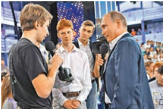
普京與「00後」出生的學生互動，大談私生活及興趣。

俄羅斯總統普京前日到索契一間學校參與電視問答騷，與「00後」出生的學生互動，其間甚少談及嚴肅的政治，反而大談私生活及興趣，他承認幾乎從沒使用年輕一代追捧的社交網。俄羅斯將於明年3月舉行總統大選，普京不排除會參選，甚至表示未決定是否會離任。分析指，現時參與反政府示威的主要是年輕人，普京顯然是借助今次活動，顯示自己受年輕一代歡迎。