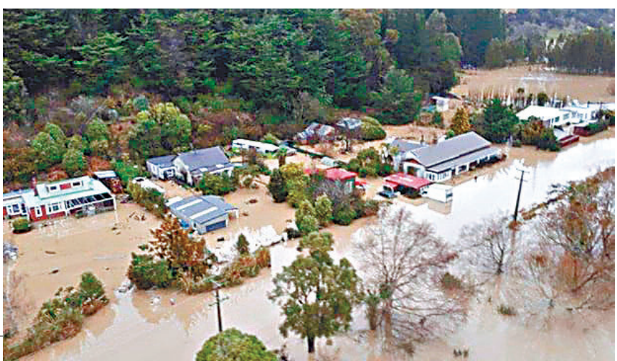
洪水淹沒奧塔哥港大片民居。網上圖片

新西蘭前晚起受猛烈風暴吹襲，多條河流氾濫，由於山泥傾瀉阻塞道路，有12萬人口的達尼丁對外交通中斷，南島最大城市基督城，以及蒂馬魯、奧塔哥港及達尼丁共4個地區昨日宣佈進入緊急狀態，當局緊急疏散數百戶居民，軍方出動至少12架卡車和200名人員拯救被洪水圍困的災民。新西蘭總理英格利希昨在社交網站twitter貼文慰問災民。