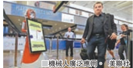
機械人廣泛應用。

個學術會議，他們指出，隨着機械人或人工智能技術廣泛應用於無人駕駛汽車、保安、護理服務及客戶服務等工作，針對機械人的安全措施變得日益重要。