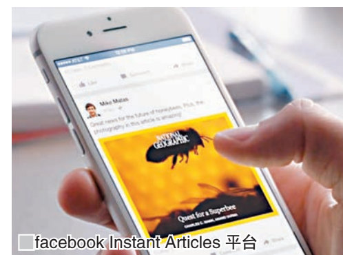
facebook Instant Articles 平台