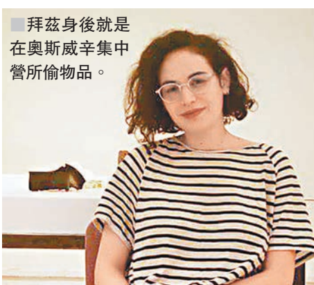
拜茲身後就是在奧斯威辛集中營所偷物品。