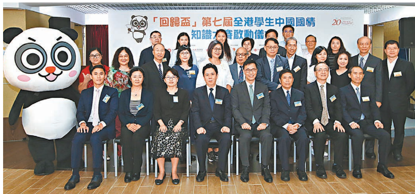
「『回歸盃』第七屆全港學生中國國情知識大賽」昨日正式啓動。

香港文匯報訊(記者 姜嘉軒)為提升學生對國情、歷史、文化、地理及藝術等多方面知識水平,教育局、香港大公文匯傳媒集團和未來之星同學會聯合主辦「『回歸盃』第七屆全港學生中國國情知識大賽」,昨日在教育局局長楊潤雄及香港大公文匯傳媒集團副董事長、總經理歐陽曉晴等主禮嘉賓見證下舉辦啓動儀式。楊潤雄形容比賽是本港學生認識國家的重要平台,有助培養愛國情操,建立正確價值觀。