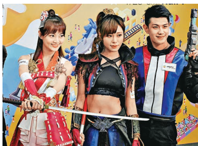
第十九屆香港動漫電玩節記者招待會。