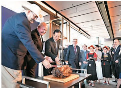
■中國近期恢復美國對華牛肉出口，但在要求美方放寬對華民用高科技產品出口上未有進展。 資料圖片

味着失敗，而對話則是因為存在分歧才進行對話，雙方在對話中互相攤牌，共同尋找雙方下一步哪些領域可以合作，能夠盡快取得成果，哪些領域不可以談，或短期內不會取得進展。他強調，對話是潤滑劑和探路石。