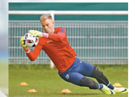
祖赫特來季為韋斯咸把關。