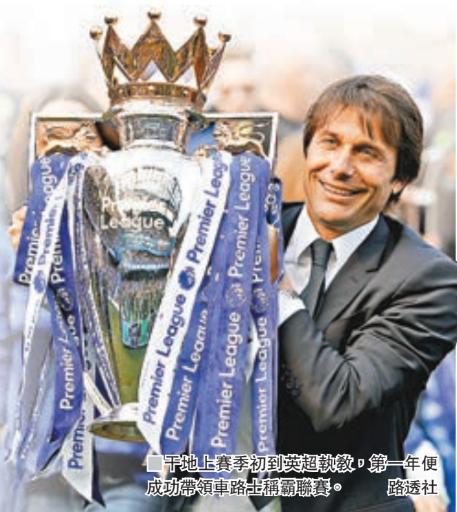
干地上賽季初到英超執教，第一年便成功帶領車路士稱霸聯賽。