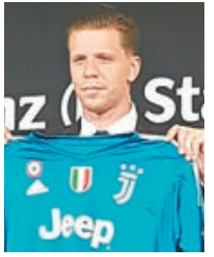
祖記簽施捷斯尼。祖雲達斯圖片