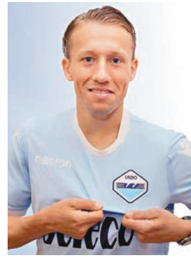
盧卡斯轉會拉素。拉素圖片