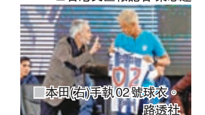
本田(右)手執 02 號球衣。

曾效力米蘭雙雄及羅馬的前意大利國足著名後衛彭路基，昨獲任命為阿爾巴尼亞國家隊新任主教練。