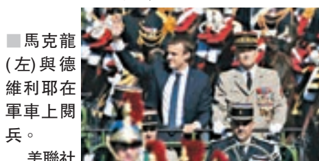
馬克龍(左)與德維利耶在軍車上閱兵。

法國總統馬克龍政府月初宣佈削減8.5億歐元(約76.5億港元)海外軍事開支，引起軍方強烈反彈，上週在國會公開批評有關決定，並因此遭到馬克龍點名斥責的總參謀長德維利耶，昨日突然宣佈辭職以示抗議。軍事分析員認為，馬克龍犯了重大政治錯誤，不但將軍方變成未來5年任期的敵人，更可能因此失去敬愛軍方的一般民眾支持。