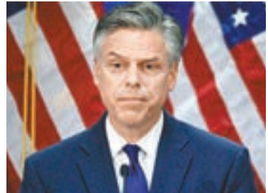
洪博培曾出任駐華大使。