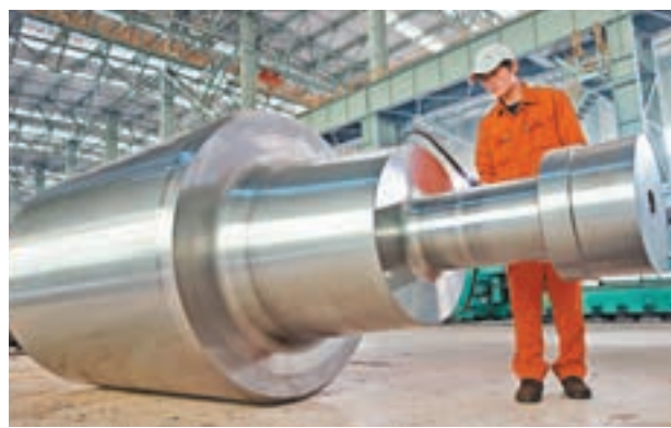
■東北特鋼現正朝市場化債轉股的方向前進，若成事將成為內地首單公募債券轉股。資料圖片

香港文匯報訊 東北特鋼破產重組案，目前正向着市場化債轉股的方向邁進，如果成事，該案將成為內地第一單公募債券轉股。但同時，債券持有人可能要做好承受損失的準備，在轉股的不確定性與較面值大幅折的現金清償之間進行選擇。