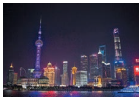
■上海的最低工資以2,300元領先全國。

資以2,300元（人民幣，下同）繼續位列榜首，西藏和廣西排名則墊底，其中廣西第四檔最低工資僅為1,000元，不及上海的一半，成為全國工資標準最低的地區。