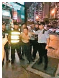
■警方趕赴現場將疑犯抓獲。

香港文匯報訊 據深圳市公安局寶安分局官方微博「平安寶安」消息，深圳市公安局寶安分局16日晚對外發佈官方通報：16日晚9時許，深圳寶安區西鄉金港華庭沃爾瑪超市內，一名男子持菜刀傷人。