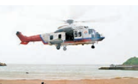
■B-7136將受困驢友分批送至安全地方。

救助人員將25名老人、婦女、兒童等行動不便者安排由救助直升機首批直接送往陸地；以青壯年人員為主的人員，分別通過直升機吊放轉運15人至「南海救111」輪，通過「南海救203」輪施放救助艇安全轉移9人。12時40分，25名