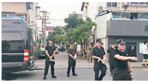
警察拉起警戒線封鎖事發地路口。