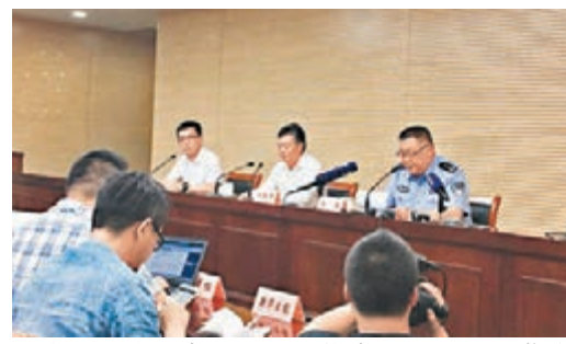
常熟市昨日舉行新聞發佈會，指火災已導致22人死亡，3人輕傷。