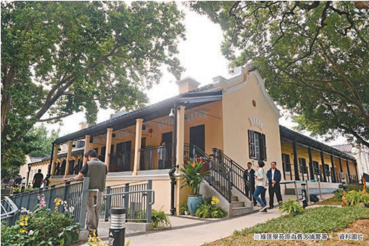
■綠匯學苑原為舊大埔警署。 資料圖片