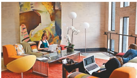
■北九龍裁判法院活化為薩凡納藝術設計學院香港分校。 資料圖片

方式營運，即是要在財務上自負盈虧，並同時發揮保育的社會功能。故此，參與計劃的機構需要制定合適營運策略，引入商業元素以獲得經常性的收入，亦要善用人力資源，組織義工團隊減省開支，例如活化成功的舊大澳警署和雷生春，分別經營餐廳酒店和醫療中心。