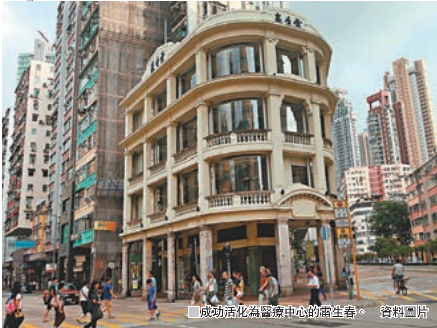
■成功活化為醫療中心的雷生春。 資料圖片