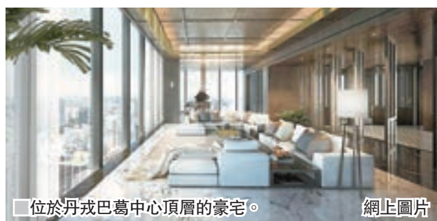
位於丹戎巴葛中心頂層的豪宅。

新加坡近年接連推出辣招，為熾熱的樓市降溫，樓價持續尋底。然而，當地一個三層高的頂層複式豪宅單位，日前叫價1億坡元