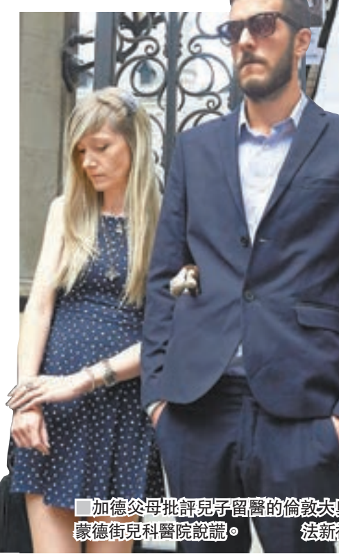
加德父母批評兒子留醫的倫敦大奧蒙德街兒科醫院說謊。

網民批喪失三個世紀文明 網民以另類方式聲援加德，他們利用Google的評論功能，中傷倫敦大奧蒙德街兒科醫院，指控醫生是「殺人兇手」，亦有人稱「把孩子帶到這間醫院，醫生會讓他們死得有尊嚴(換言之殺掉)」。