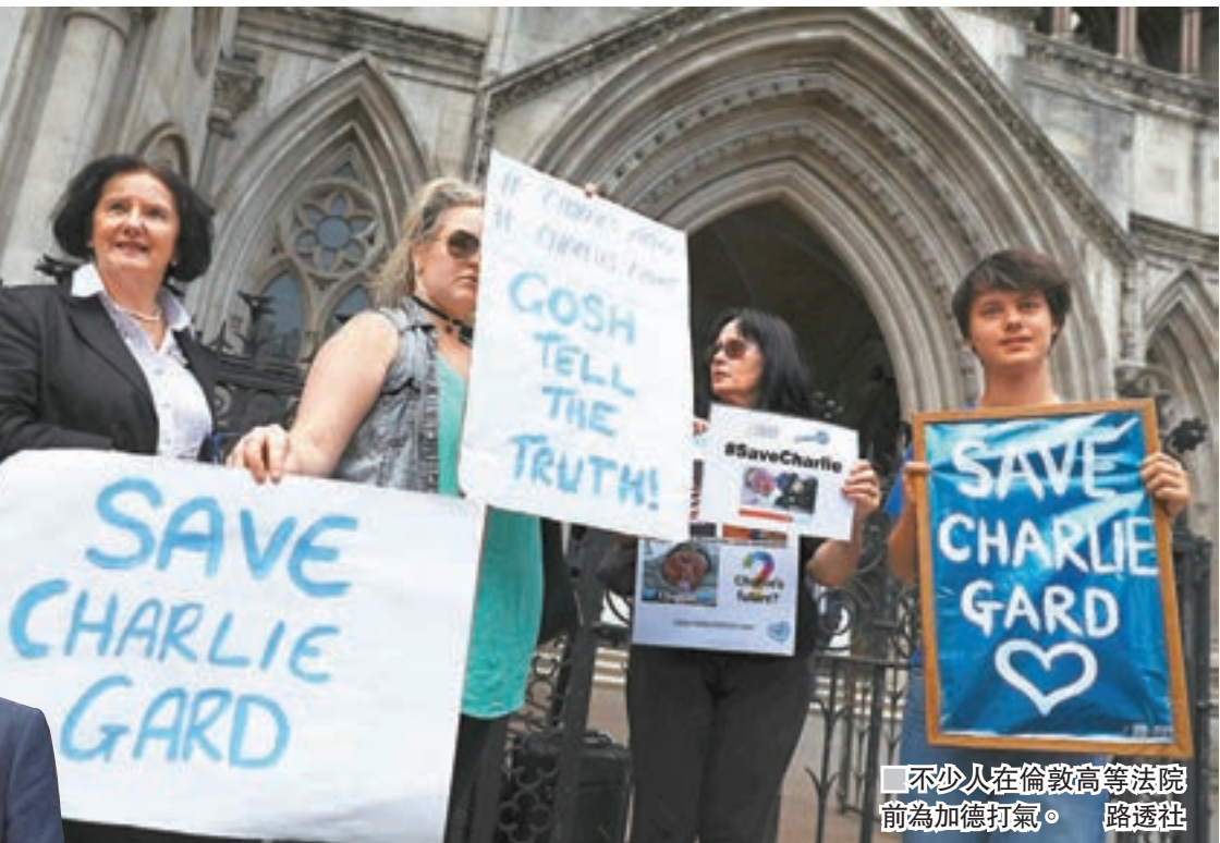
不少人在倫敦高等法院前為加德打氣。