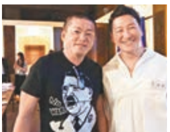
堀江(左)當日身穿希魔T恤。

日本前網絡大亨堀江貴文前日在日本放送協會(NHK)清談節目擔任嘉賓時，身穿印有納粹領袖希特勒圖像的黑色T恤，遭受外界抨擊，NHK為事件道歉。堀江在推特twitter指批評者「心理脆弱」，表示T恤印有和平標誌及希特勒呼喊「不要戰爭」的圖案，顯然是祈求和平的訊息，此前已多次穿着，今次是首次引起爭議，認為太多人不懂幽默。