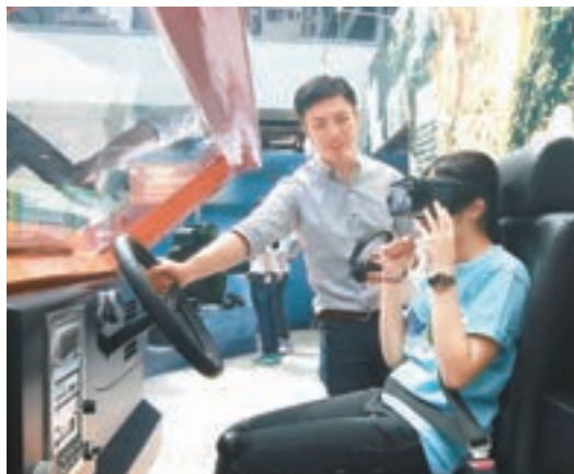
市民可戴上VR眼鏡，以多個角度，感受1972年的秀茂坪土坡崩塌事件和寶珊道的山泥傾瀉的震撼場面。