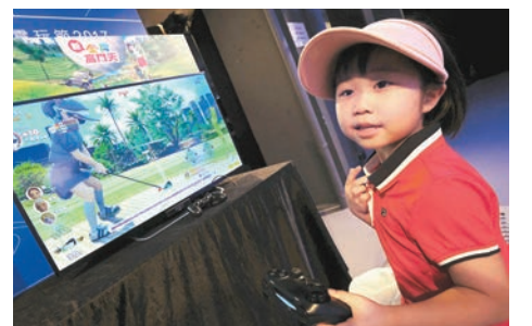
PlayStation電玩節將設置約50台遊戲機供市民试玩。

媽」透過網上問卷訪問310名6歲至12歲的小孩，發現近40%受訪者希望成為網絡「KOL」(key opinion leader)。調查指，32%受訪者會在網上表演唱歌、16%會直播打機。至於想成為「KOL」的原因，58%受訪者希望更多人認識自己、40%希望成為具影響力的人、34%冀可於人前展現才華。