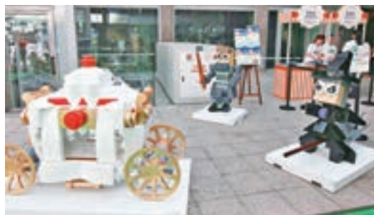
展覽同時展出「山泥魔」卡通角色公仔。