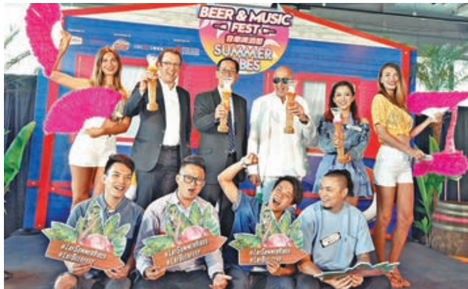
蘭桂坊呈獻「夏日狂潮派對」，料吸引15萬人次狂歡。

盛智文指出，科技是未來大勢，內地已成為領導者，不少人用支付寶或微信支付，反而香港仍用現金及信用卡，仍