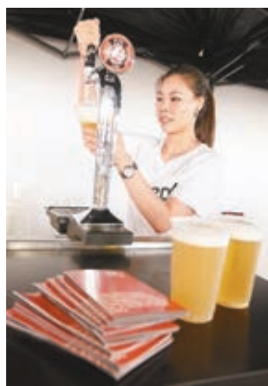
「香港友」等土炮品牌將會現身。

處於較遲起步階段，認為香港不可再落後。他表示，去年萬聖節推出手機應用程式後，反應不錯，帶動不少年輕人到場，故今次啤酒節首次與嘜味餐單平台「肥美達人(FeedMe Guru)」合作，顧客