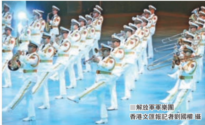
解放軍軍樂團