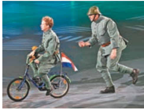
荷蘭皇家陸軍騎兵軍樂團踩着單車演奏，形式新穎。