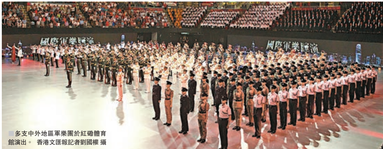
多支中外地區軍樂團於紅磡體育館演出。

她表示，比入場時間早了兩個小時到，有幸率先與中外軍人合照，認為可近距離接觸的機會十分難得。她指外國的軍人比較健談、笑容亦較多，