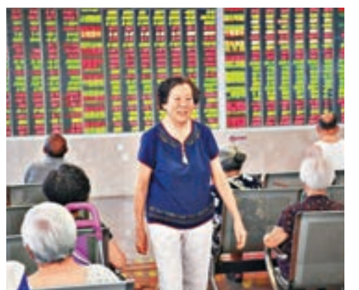
IPO提速下滬深主板連續三日下挫。

郭台銘旗下FIT HON TENG（6088）公佈招股結果顯示，在本港公開發售部分錄得超購1.39倍。該股定價為每股2.7元，略低於招股價2.38至3.08元範圍的中間價2.73元，預期集資淨額約25.39億元。按一手1,000股計，中籤率100%。