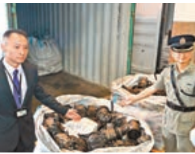
海關展示用作掩飾私煙的汽車零件。

未列艙單貨物，一經定罪，最高可被判罰款200萬元及監禁七年。市民可致電海關24小時熱線2545 6182舉報懷疑私煙活動。