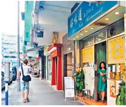
發生大爆炸的好味道茶餐廳已經經營十多年。