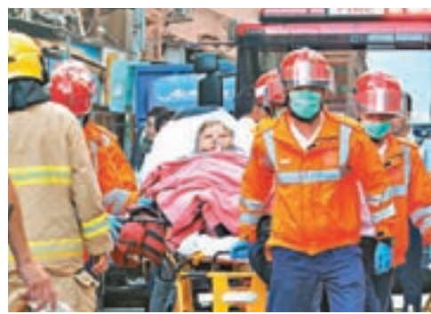
受驚茶餐廳老闆娘獲送院。