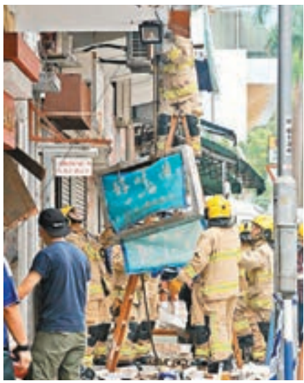
茶餐廳的招牌亦遭炸毀。

九龍西助理消防區長黃炳權表示，消防在現場搬出兩個各重約15公斤的石油氣樽，兩氣樽均沒有損毀，初步懷疑是石油氣洩漏肇禍，會就事件聯同機電署調查事故起因。機電署表示初步懷疑事故與廚房內的石油氣裝置發生氣體洩漏有關，沒發現食肆儲存過量石油氣，事後已檢走有關裝置作詳細檢查及跟進。