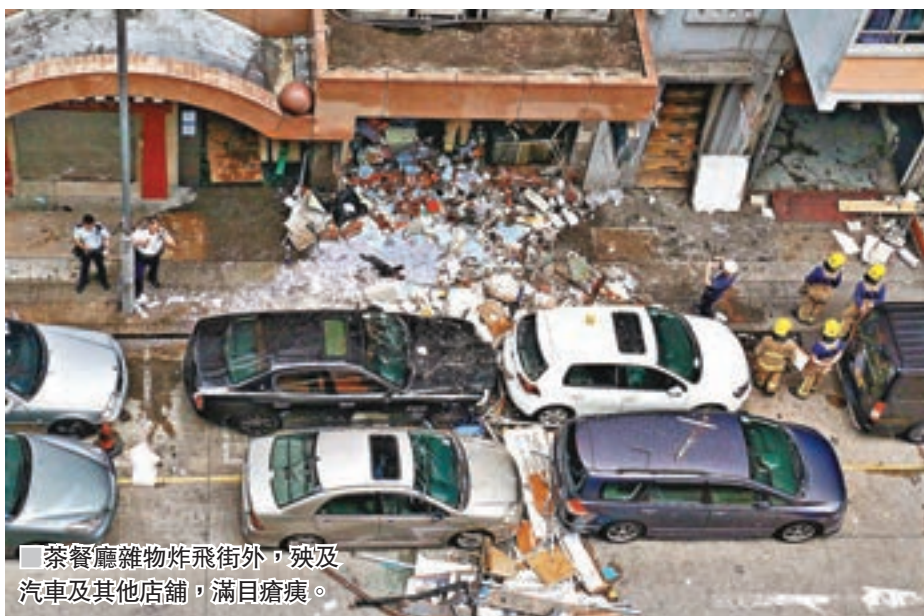
茶餐廳雜物炸飛街外，殃及汽車及其他店舖，滿目瘡痍。

香港文匯報訊（記者杜法祖）土瓜灣發生罕見石油氣大爆炸，前日剛更換石油氣罐並檢查過爐具的一間茶餐廳，懷疑因有石油氣通宵洩漏積聚，至昨清晨開門營業，廚工甫撻爐即引發大爆炸，整間食肆被炸至滿目瘡痍全變廢墟，舖內雜物隨爆炸強勁氣流噴出店外，殃及街外汽車、咪錶及附近店舖招牌及鐵閘，意外中一名廚工及一名食客當場重傷命危，另一食客及老闆娘分別輕傷及受驚。消防聯同機電署正調查事故肇因。