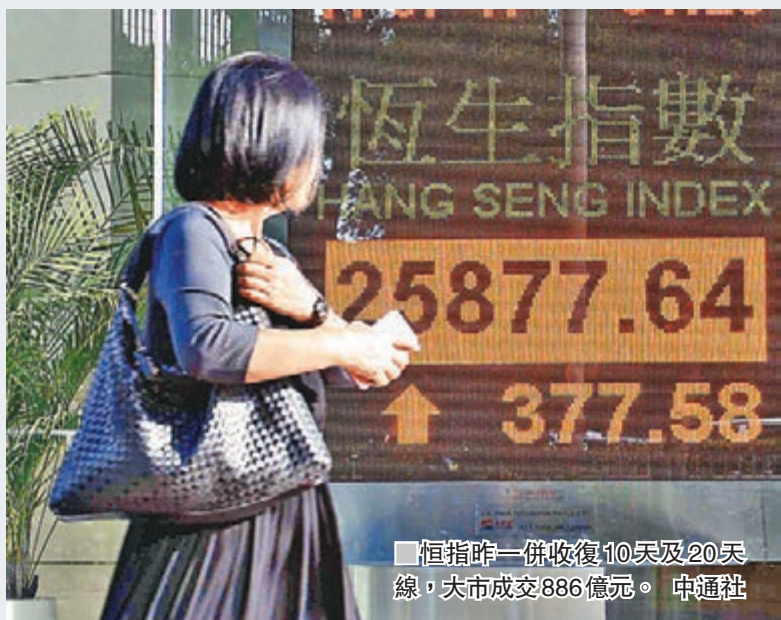
恒指昨一併收復10天及20天線，大市成交886億元。 申通社

香港文匯報訊 (記者 周紹基) 北水連續兩日錄逾30億元人民幣流入，加上「摩笛」唱好內銀股及國際金融股，有關板塊帶動港股昨日一度升逾400點，高見25,941點，收市仍有377點的進賬，全日收報25,877點，一併收復10天及20天線，技術走勢進一步轉好，大市成交886億元。摩根士丹利表示，內銀股即將迎來兩至三年的息差擴張期，故上調部分內銀股目標價。工行(1398)、建行(0939)、農行(1288)昨升幅近3%至4%。