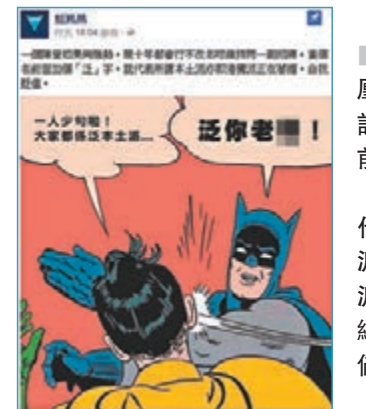
云粉「藍鳳凰」發帖批評：「當個名前面加個『泛』字，就代表所謂本土派亦即『港獨派』正在萎縮，自我貶值。」