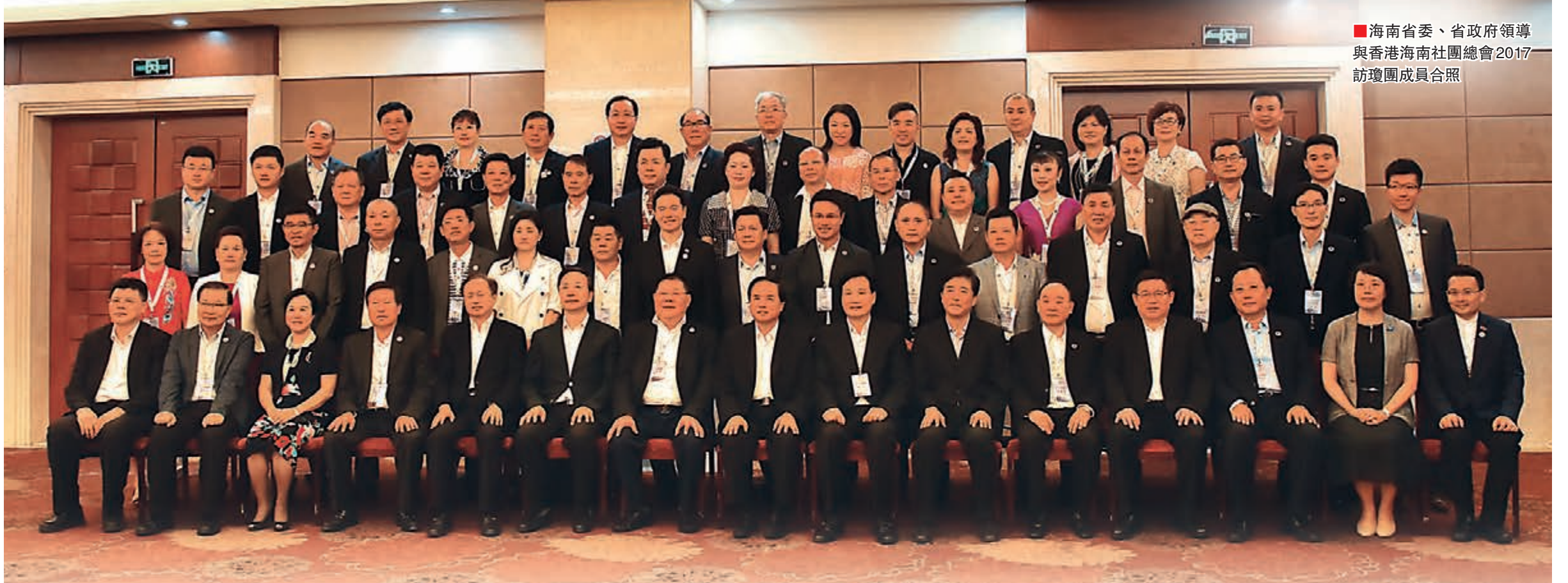
■海南省委、省政府領導與香港海南社團總會2017訪瓊團成員合照