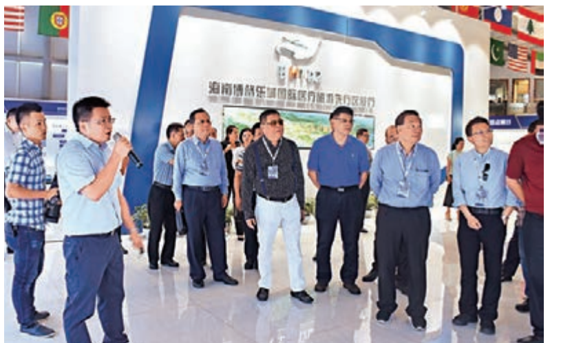
■訪瓊團在瓊海參觀博鰲樂城國際醫療旅遊先行區展廳