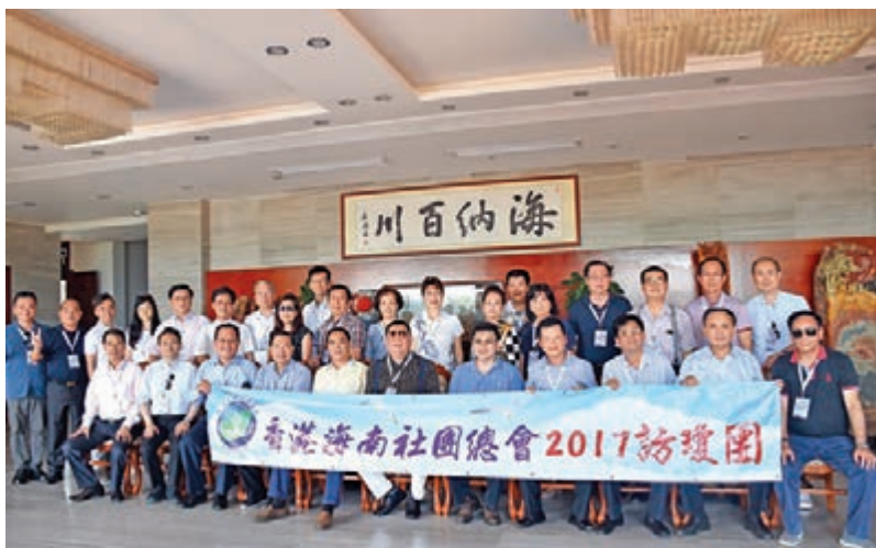
■訪瓊團在香港萬寧同鄉會萬寧會所敘鄉情，團員合影留念。