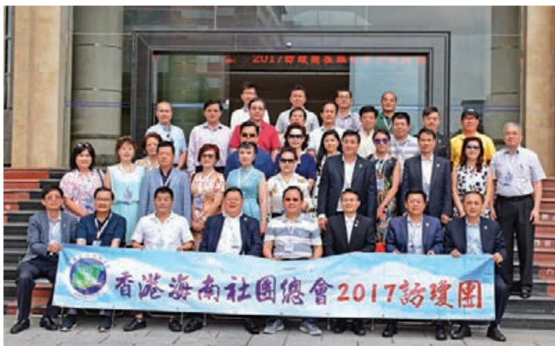
■訪瓊團參觀海南工商職業學院，團員合影留念。