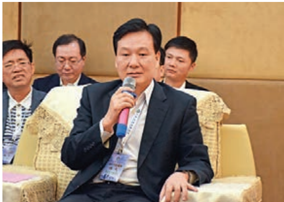
■林武在座談會對香港海南社團總會的貢獻表示充分肯定

13及14日在瓊期間，一行人參觀考察了博鰲樂城國際醫療旅遊先行區，了解家鄉國際化的醫療旅遊建設，讓團員大開眼界；14日前往萬寧市石梅半島項目，了解高級五星級度假酒店的設計和服務；15日前往三亞市參觀了首個市內以旅客為目標服務群的一體式服務中心，面向市民及旅客，提供諮詢、旅遊服務與投訴、舉報，為三亞市的旅遊奠定了安寧穩定的基礎，讓團員們深深感受到三亞旅遊勝地的魅力。