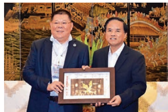
■張泰超與海南省委書記劉賜貴（右）互贈紀念品

將會突出宣傳海南，招商引資，我們的宣傳部可以配合拍攝、刊登報紙，提供總會所需要的影像資料，全力支持工作。」