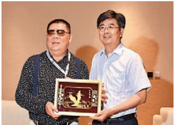
■張泰超與三亞市市長吳巖峻（右一）互贈紀念品