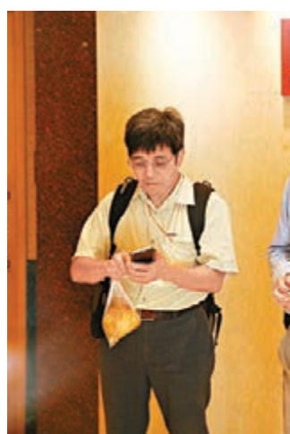
致命工業意外家屬到金城開會。