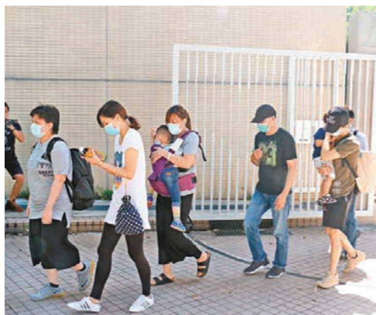
遇難工人的家屬到葵涌公眾殮房認屍,各人神情哀傷。