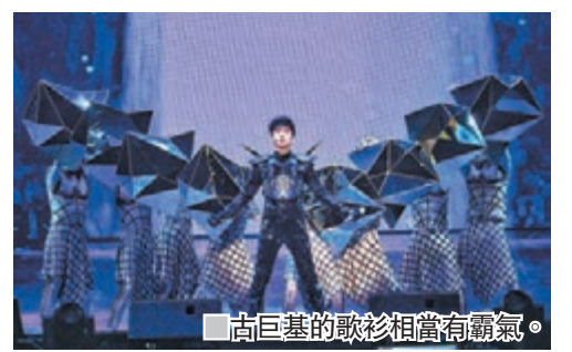
古巨基的歌衫相當有霸氣。