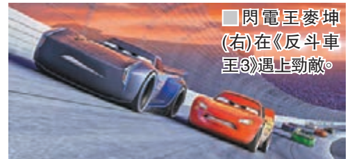
閃電王麥坤(右)在《反斗車王3》遇上勁敵。