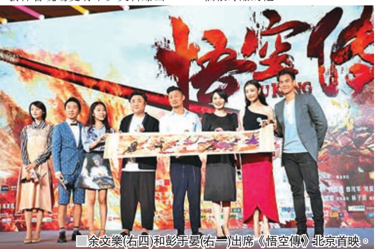
余文樂(右四)和彭于晏(右一)出席《悟空傳》北京首映。

幾位主角更在台上分享對電影的感受，當中彭于晏表示「大家會看到一個不一樣的，也會看到一個不一樣的孫悟空」，倪妮則指這次「痞子仙女」的形象定位讓人耳目一新。樂仔則稱觀眾在戲中將看到一個很冷酷的他。