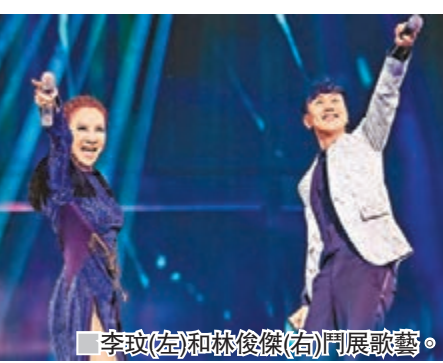
李玟(左)和林俊傑(右)鬥展歌藝。

香港文匯報訊 (實習記者張美婷) 2017年李玟 (CoCo) 的「18」世界巡迴第三站「賽菲爾之夜」，日前於北京完美落幕，而是次巡演的焦點，必是李玟和林俊傑 (JJ) 這兩位唱得之人同台演出。二人當晚在台上演繹一曲全新改編版的《月光愛人》和《不潮不用花錢》，CoCo更表示很喜歡《不》這首歌，因歌詞中有很多「叩叩」(與CoCo同音)，好像創作者很喜歡自己的樣子，JJ更連番點頭回應。當JJ唱到「請你不要到處叩叩」時，CoCo突然唱到「JJ」，令JJ也馬上以「CoCo」回應，兩人顯得十分默契。作為好友，CoCo也十分關心JJ，更在現場催婚，問他何時成家立室。JJ卻害羞回應：「一切只能看緣分，最重要找到那個對的人。」