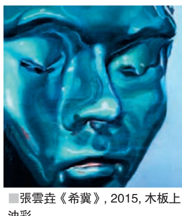
張雲垚《希冀》，2015，木板上油彩