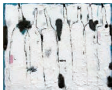
瓶子327, Oil on canvas 油畫, 110 x 130 cm, 2016

藝評人彭鋒說，吳松筆下的酒瓶因為融化而變得酥軟，玻璃或陶瓷的堅硬和銳利蕩然無存。但是，吳松並沒有讓他的酒瓶徹底消解，進入無對象的抽象領域。那些因為融化而酥軟的酒瓶，又在努力找回它們的形狀，在經歷「見山不是山」的階段之後，進入「見山還是山」的境界。這個重新找回的形，不再是自然主義的形，而是現象學的形。 文：張夢薇