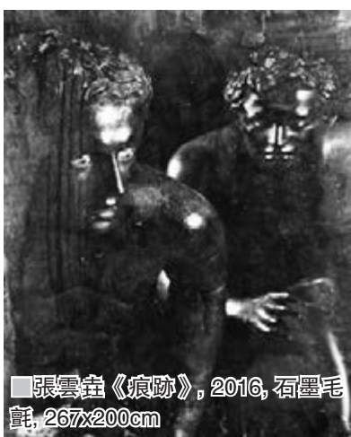
張雲垚《痕跡》，2016，石墨木彫，267x200cm