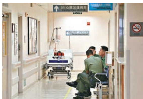
■荔枝角羈留犯上吊命危，懲教署人員在深切治療病房外看守。

懲教署發言人表示，懲教人員昨晨8時01分，在荔枝角收押所制止一名28歲男性還押在囚者上吊自殺。