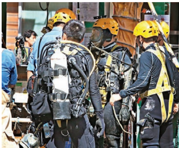
■消防蛙人落沙井搜救失蹤工人後重上地面。