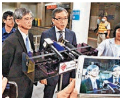
■勞工及福利局局長羅致光偕勞工處處長陳嘉信到醫院慰問遇難工友的家屬。