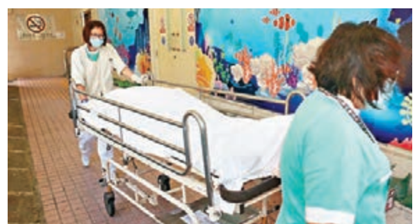
■首先救出的工人送院證實不治，遺體昇送殮房。

他強調，工程已做足安全措施及風險評估，地底及地面亦有同事支援。承辦商金城營造行政總裁王紹恆對事故感到難過，向家屬致以深切慰問，已即時向3名死者的家庭各發放10萬元現金應急。