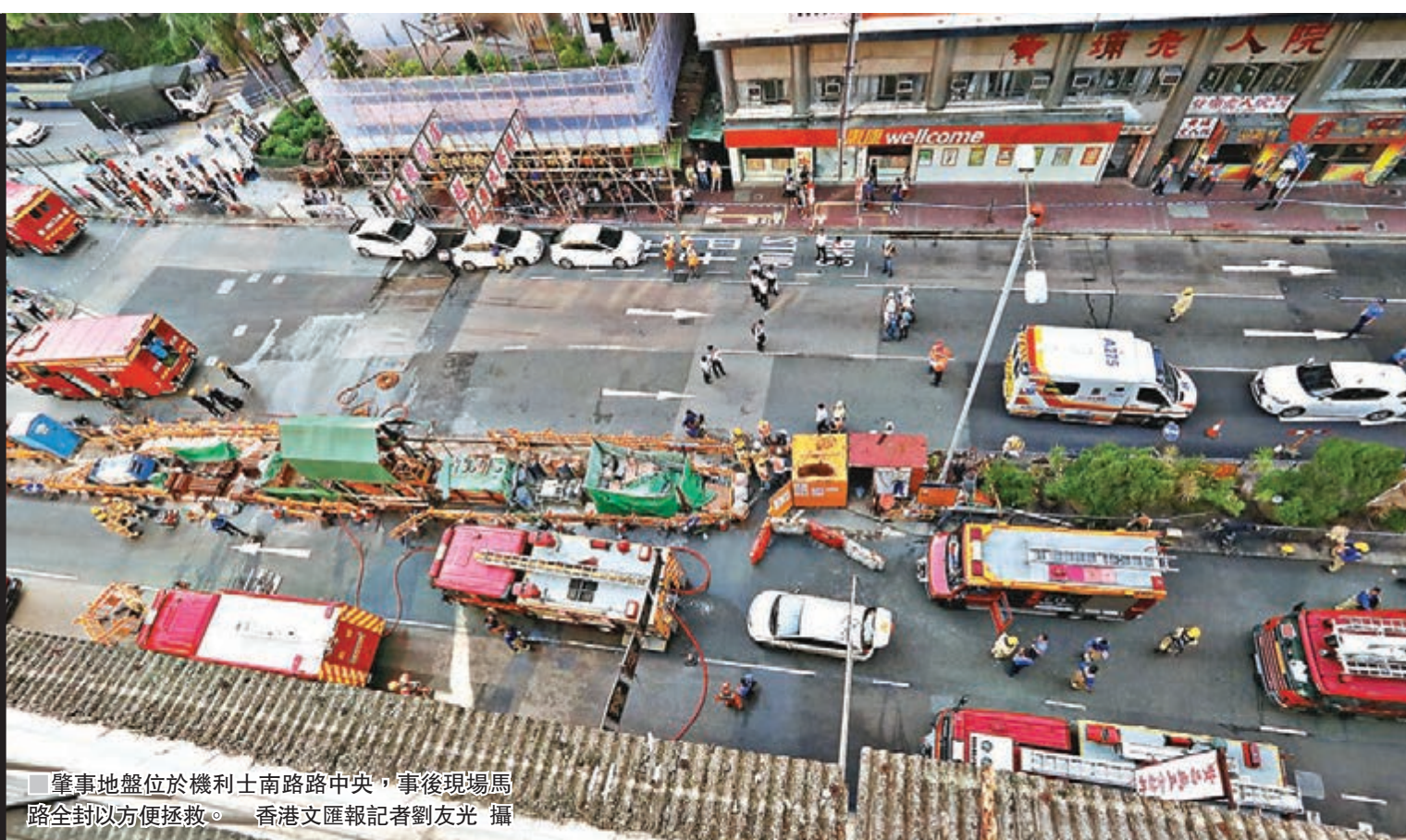
■肇事地盤位於機利士南路中央，事後現場馬路全封以方便拯救。