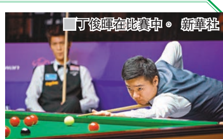
丁俊暉在比賽中。

昨日,在江蘇無錫舉行的2017桌球世界盃進入4強階段,在首場4強賽中,由梁文博/丁俊暉組成的中國A隊在先輸兩局的不利局面下連勝四局以4:2戰勝了泰國隊,闖入決賽。可是在另一場4強賽中,由周躍龍/顏丙濤組成的中國B隊3:4惜敗於英格蘭,沒能實現與A隊在決賽會師。最後在決賽中,中國A隊以局數4:3擊敗英格蘭,成功奪標,實現三連霸。