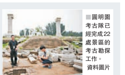
圓明園考古隊已經完成22處景區的考古勘探工作。資料圖片