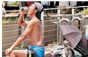
東京民眾赤膊散熱，小狗打傘遮陰。