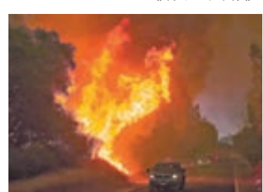
加州總共發生17宗山火，災場面積增至1.9萬公頃。