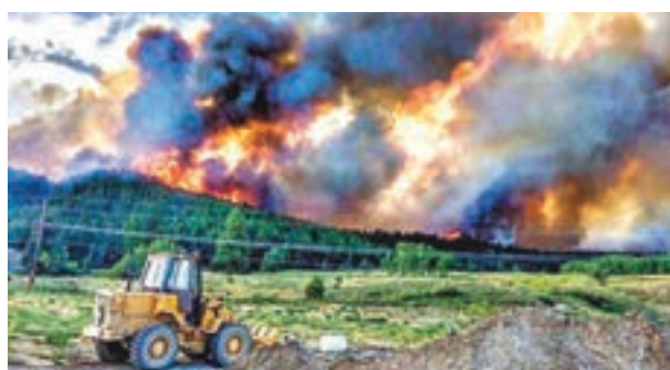
單在周六，卑詩省已出現多達138個新火頭。