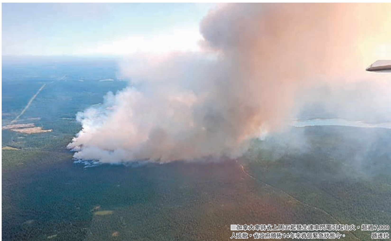
加拿大卑詩省上周五起發生連串閃電引起山火，超過7,000人疏散，省政府頒佈14年來首個緊急狀態令。