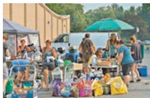
緊急庇護中心接濟受影響居民。