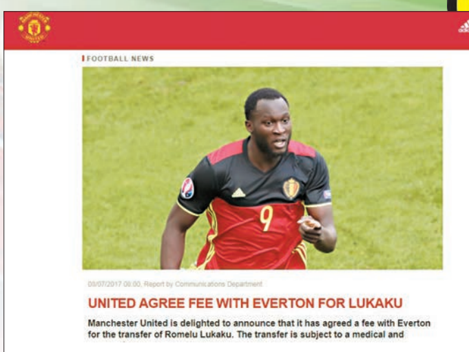
曼聯官宣佈盧卡古轉會達成協議。

昨日，英超曼聯官方網站宣佈，已經就盧卡古的轉會交易與愛華頓達成協議，交易有待球員完成體檢以及商定合約個人條款後正式完成。據此前天空體育、《每日郵報》、《每日鏡報》等英國媒體透露，此次盧卡古的轉會費約為7500萬英鎊。