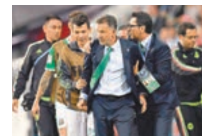
墨西哥主帥奧蘇里奧(中)。