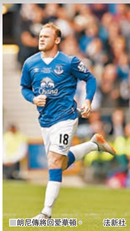
朗尼傳將回愛華頓。