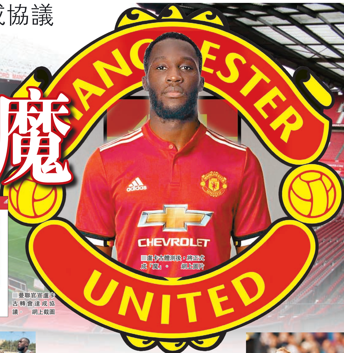
盧卡古體測後，將正式成「魔」。網上圖片

能夠如此迅速的談妥這樁轉會，曼聯隊長朗尼或許在其中扮演了重要的角色。根據媒體的報道，朗尼已經無限接近愛華頓，而且曼聯並未從中收取任何轉會費。由於免費將朗尼送至愛華頓，曼聯收購盧卡古的轉會費也並非是媒體此前報道的1億英鎊，雙方最終以7500萬英鎊的價格達成一致。