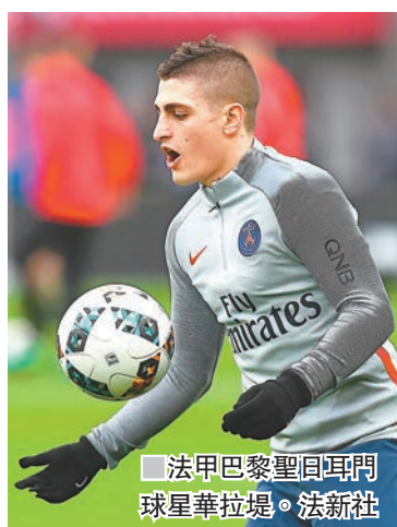
法甲巴黎聖日耳門門球星華拉堤。