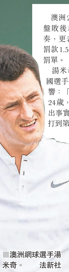
澳洲網球選手湯米奇。

澳洲24歲網球選手湯米奇，在溫網首輪直落三盤敗後承認，在比賽中詐傷是為了打亂對手節奏，更表示對網球已失去熱情，昨日遭國際網聯罰款1.5萬美元，這也是大滿貫賽歷史上第2重的罰單。