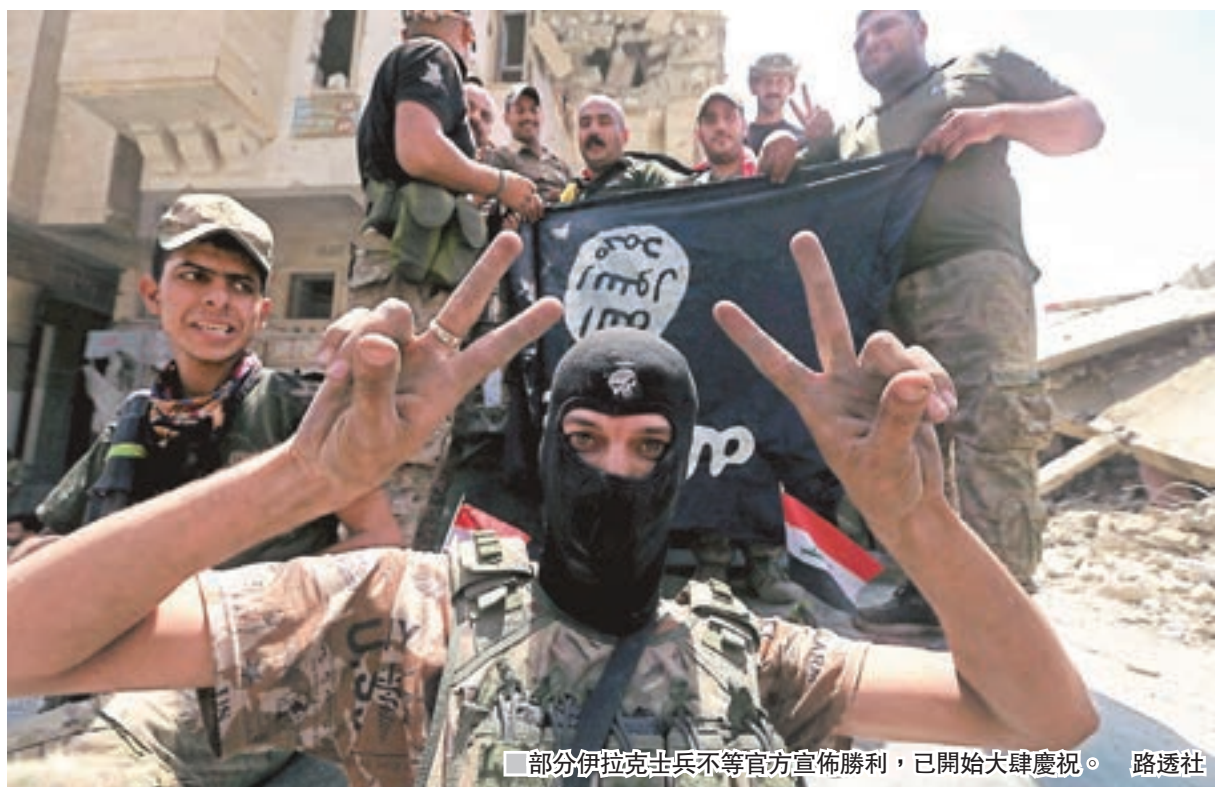
部分伊拉克士兵不等官方宣佈勝利，已開始大肆慶祝。