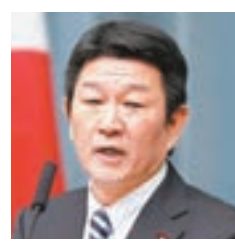
有望成為外相的茂木敏充。