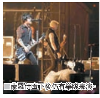
蒙羅伊墮下後仍有樂隊表演。

Mad Cool音樂節，豈料在參與期間不幸喪生。Mad Cool主辦單位表示，對意外感到遺憾，大會是基於保安理由繼續舉行音樂會，特意在昨日安排一個環節，向對方致意。