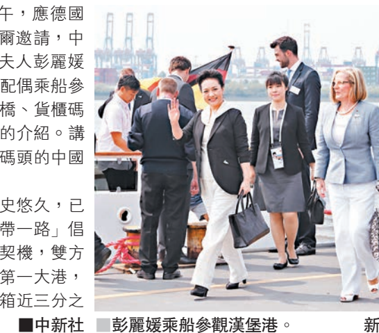
■ 彭麗媛乘船參觀漢堡港。

當地時間 7 日上午，應德國總理默克爾夫人邀請，中國國家主席習近平夫人彭麗媛同出席 G20 峰會的部分代表團團長配偶乘船參觀漢堡港。大家乘船參觀港口、棧橋、貨櫃碼頭等，聽取有關漢堡港概況及歷史的介紹。講解員特地向大家介紹一艘正停泊在碼頭的中國貨櫃貨輪。 彭麗媛表示，漢堡同中國交往歷史悠久，已成為連接中歐經濟界的橋樑。「一帶一路」倡議為中國同漢堡加強合作提供了新契機，雙方互利合作大有可為。漢堡港是德國第一大港，也是歐洲第二大貨櫃港。該港貨櫃箱近三分之一來自中國。