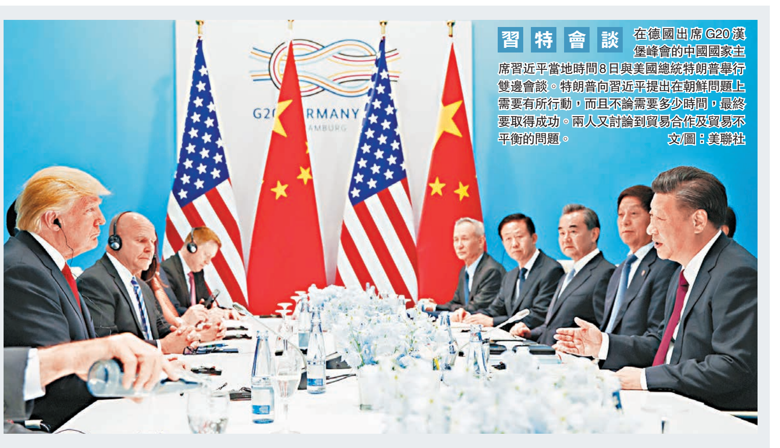
習特會談 在德國出席 G20 漢堡峰會的中國國家主席習近平當地時間 8 日與美國總統特朗普舉行雙邊會談。特朗普向習近平提出在朝鮮問題上需要有所行動，而且不論需要多少時間，最終要取得成功。兩人又討論到貿易合作及貿易不平衡的問題。 文/圖：美聯社