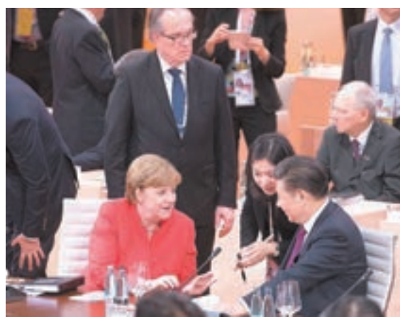
■ G20 峰會 7 日在德國漢堡舉行。圖為習近平同默克爾交談。

習近平強調，不久前，中國成功舉辦「一帶一路」國際合作高峰論壇，在促進政策溝通、設施聯通、貿易暢通、資金融通、民心相通上取得豐碩成果，努力打造治理新理念、合作新平台、發展新動力。這同二十國集團的宗旨高度契合。