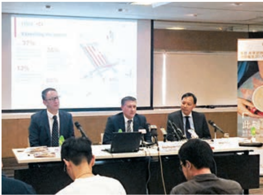
匯豐發表的「千禧世代」調查顯示，滿意現時對退休後的財務安排只有37%。

香港文匯報訊（記者 陳楚倩）匯豐的「千禧世代」調查顯示，只有三成的受訪在職人士表示滿意現時對退休後的財務安排，較兩年前的調查，比例大幅減少24%。匯豐香港區零售銀行及財富管理業務主管欣格雷表示，在職人士對退休後的生活感到悲觀，主要由於