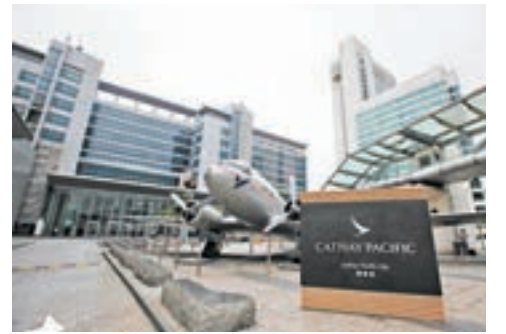
國泰航空收購DHL擁有華民航空40%股權後，已全資擁有華民航空。

香港文匯報訊 國泰航空(0293)昨天宣佈，與國際速遞公司DHL訂立無約束力的諒解備忘錄，擬向後者收購華民航空四成股權至全資擁有；華民航空並將與DHL就貨機資產訂立售後回租交易及包板協議。「包板」為空運術語，即「承包集裝板」。