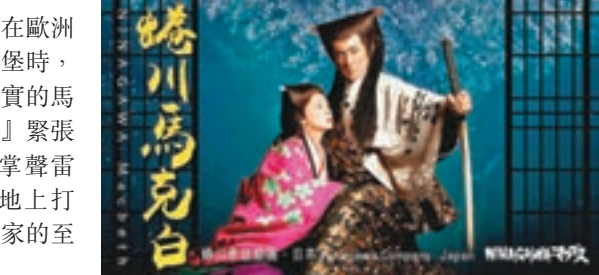
日本導演蜷川幸雄的作品《蜷川馬克白》上月底在港公映。

於是，《蜷川馬克白》在上月底來到了香港文化中心大劇院，以日本十六世紀的安土桃山時代為背景，向香港觀眾演繹了一個名叫馬克白的日本將領和他的夫人的弒君故事。