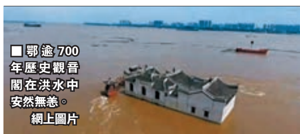
■鄂逾700年歷史觀音閣在洪水中安然無恙。網上圖片