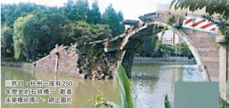
■昨日，杭州一座有250年歷史的石拱橋——歡喜永寧橋坍塌了。網上圖片

2014年12月，為了騎車過河方便，永寧橋的橋面石板鋪設了水泥通道，當時就有很多市民提出質疑，這種加蓋水泥通道，老橋是否能承受得住。