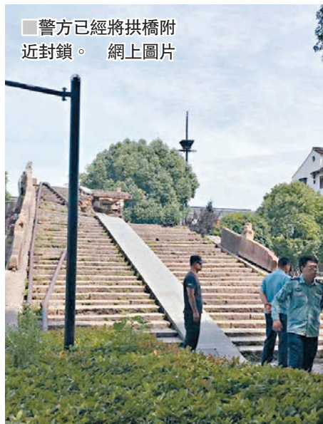
■警方已經將拱橋附近封鎖。