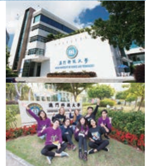
■澳門科技大學培養具有國際視野的人才

澳門科技大學由即日起至7月17日接受香港生入學申請學士學位課程。歡迎具備中六畢業或同等學歷者報名，若持香港中學文憑考試(HKDSE)3、3、2、2、2，可免試直接入學。詳情請瀏覽大學網址www.must.edu.mo。