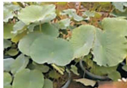
■兩盆在土層中沉睡近8個世紀後甦醒的古蓮子，蓮葉如盤，姿態挺拔。