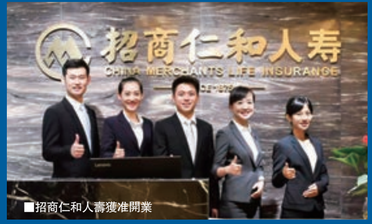
■招商仁和人壽獲准開業