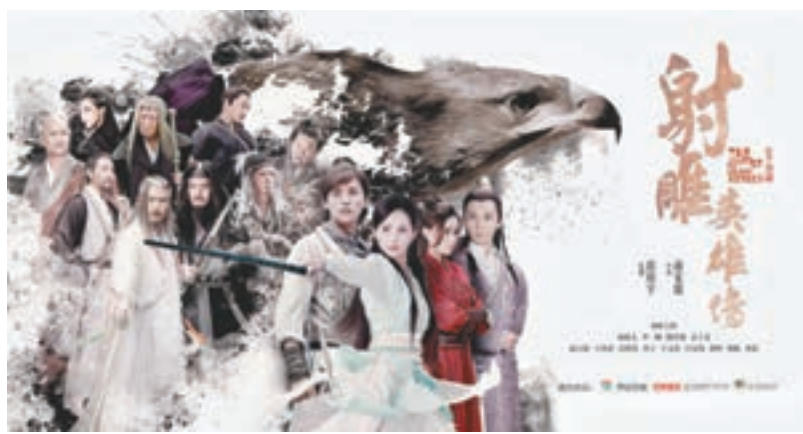
《射鵰英雄傳》電視劇集海報。網上圖片

男女主角走在一起，真的是俊男美女、金童玉女，那就完全違反了小說的原意。要知道郭靖自小習武，筋骨應是強健扎實；他又在蒙古大漠長大，受盡風沙雪霜；生活更是勤勞艱苦，外形一定是強壯精悍，面相是勇敢堅毅，而距「俊美」兩字應是甚遠。黃蓉愛他，不是愛他