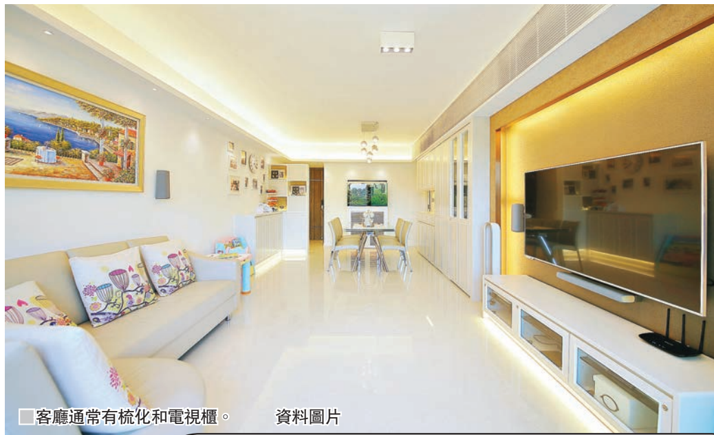
客廳通常有梳化和電視櫃。