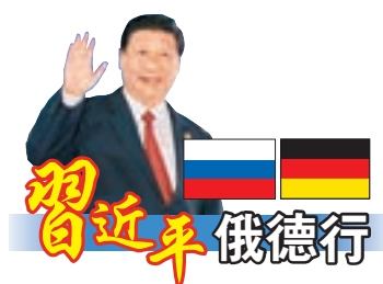
中國國家主席習近平5日在柏林會見德國總理默克爾。習近平表示，希望德方重視妥善處理有關問題，為中德關係發展成全面戰略協作夥伴關係。

香港文匯報訊 習近平訪德期間，中國航空器材集團公司5日在德國柏林與空中客車公司簽署了一筆大訂單，以228億美元（約1,780億港元）採購140架空客飛機，包括100架A320系列飛機及40架A350XWB系列飛機。據中新社報道，空客首席執行官托馬斯·恩德斯表示，中國目前是全球最重要的航空市場之一。報道指，該筆訂單充分顯示了中國航空公司在各級市場上的強勁需求，無論是國內市場、低成本市場、區域及遠程國際航線市場。