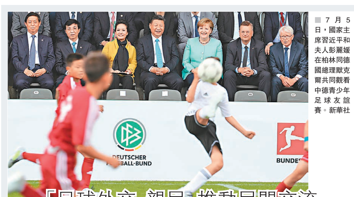
7月5日，國家主席習近平和夫人彭麗媛在柏林同德國總理默克爾共同觀看中德青少年足球友誼賽。

除了與中國航材公司的訂單簽署，空客還與中國其他航空工業企業有合作。中國的航空工業企業承擔了A350機體5%的製造任務。同時，A350相關項目落地中國還催生了空客（北京）工程技術中心和哈爾濱空客複合材料製造中心兩家合資企業的誕生，分別承擔A350的設計和複合材料部件的生產工作。