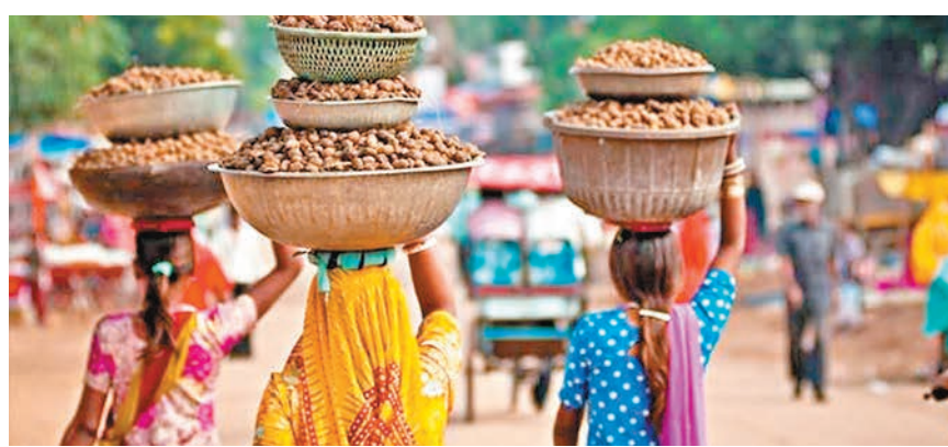
印度今年經濟增長持續樂觀，IMF料增長有望達7%。

印度強勁的經濟增長，無疑是帶動股市走強的最大推手之一。鉅亨網投顧指出，與整個新興市場相比，自2009年以來，印度的經濟增長率不僅高於整個新興市場，亦高於全球，尤其從2012年開始，不受到全球經濟面臨走緩的壓力，印度仍維持好表現。 經濟料增7% 企業盈利樂觀 根據IMF(國際貨幣基金組織)預測，今年印度經濟增長率可達6.8%，高於新興市場的4.1%，也領先全球的3.1%。另外，IMF進一步預測印度2017年至2020年的實質經濟增長率都可維持7%以上的水平，只要印度經濟增長持續強勁，印度股市都可望獲得支撐持續上揚。 鉅亨網投顧進一步分析，不僅經濟增長強勁，印度的企業盈利能力也持續