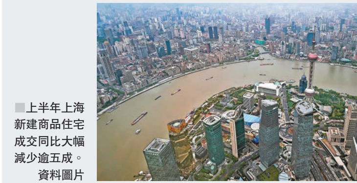
上半年上海新建商品住宅成交同比大幅減少逾五成。資料圖片

示,今年上海樓市淡季特徵提前釋放,6月儘管有部分房企為年中業績加大推盤,但市場整體動力不足。此外,6月向來是銀行收緊房貸時期,也打擊購房者入市信心。在接下來的7月和8月,步入樓市傳統淡季,業內預料冷清局面沒有機會得到改觀。