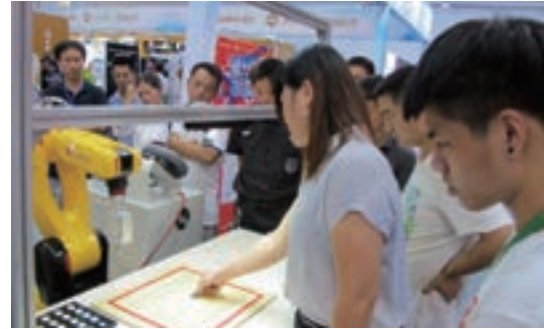
■ 高科技新奇產品吸引觀眾