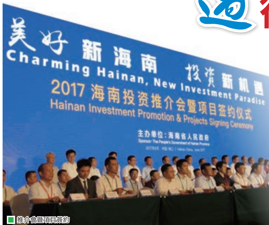
■ 推介會暨項目簽約

劉賜貴表示，海南在建設國際旅遊島的過程中，堅持生態第一，嚴守生態底線。同時，打造「美麗海南百鎮千村」工程，全力推進美麗海南百個特色產業小鎮千個美麗鄉村建設，把綠水青山變成百姓的金山銀山。劉賜貴向廣大客商發出誠摯邀請：明年這個時候再見。