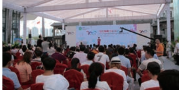
■ 共舉行40場推介會及項目考察